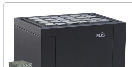
Optionale Cubius Steine