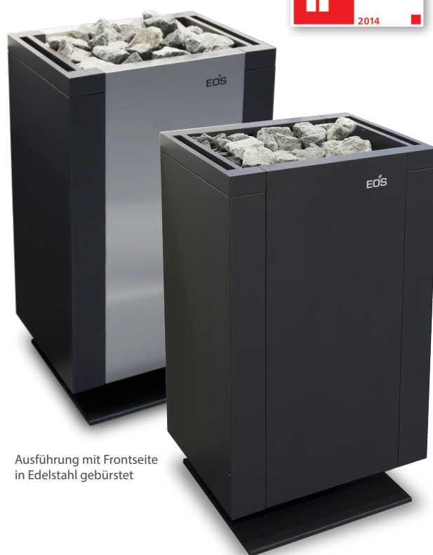
Ausführung mit Frontseite in Edelstahl gebürstet