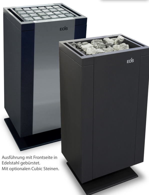
Ausführung mit Frontseite in Edelstahl gebürstet. Mit optionalen Cubic Steinen.