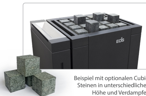
Beispiel mit optionalen Cubic Steinen in unterschiedlicher Höhe und Verdampfer